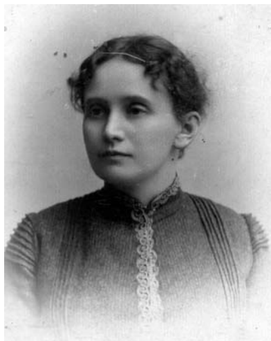
Нат.С. Лаппо-Данилевская (1890-е)