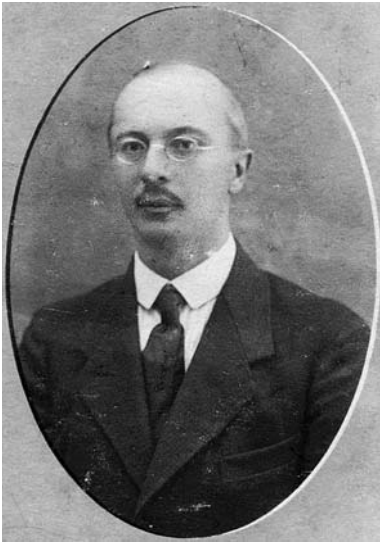
Г.Н. Лаппо-Данилевский (1910-е)