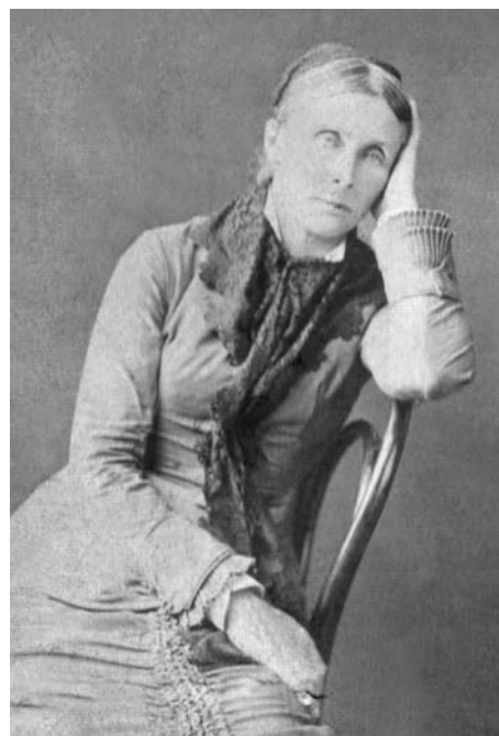
Н.Ф. Лаппо-Данилевская (1870-е)