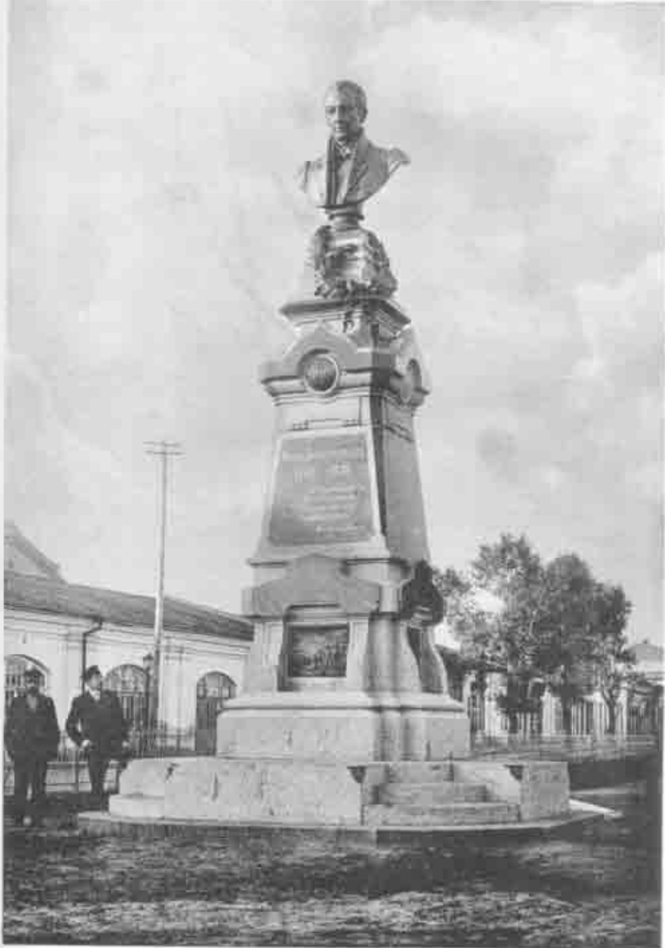
Памятникъ Н. П. Котляревскому въ г. Полтавѣ.